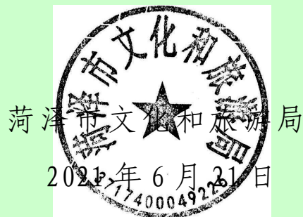
菏泽市文化和旅游局