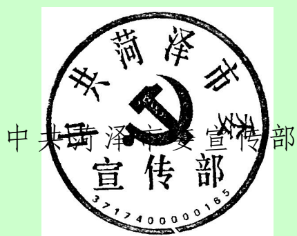
中共菏泽市委 宣传部